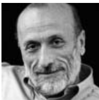
STORIE DI PIEMONTE con Carlo Petrini