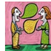
FAR SUCCEDERE COSE CON LE PAROLE con Nadia Somale